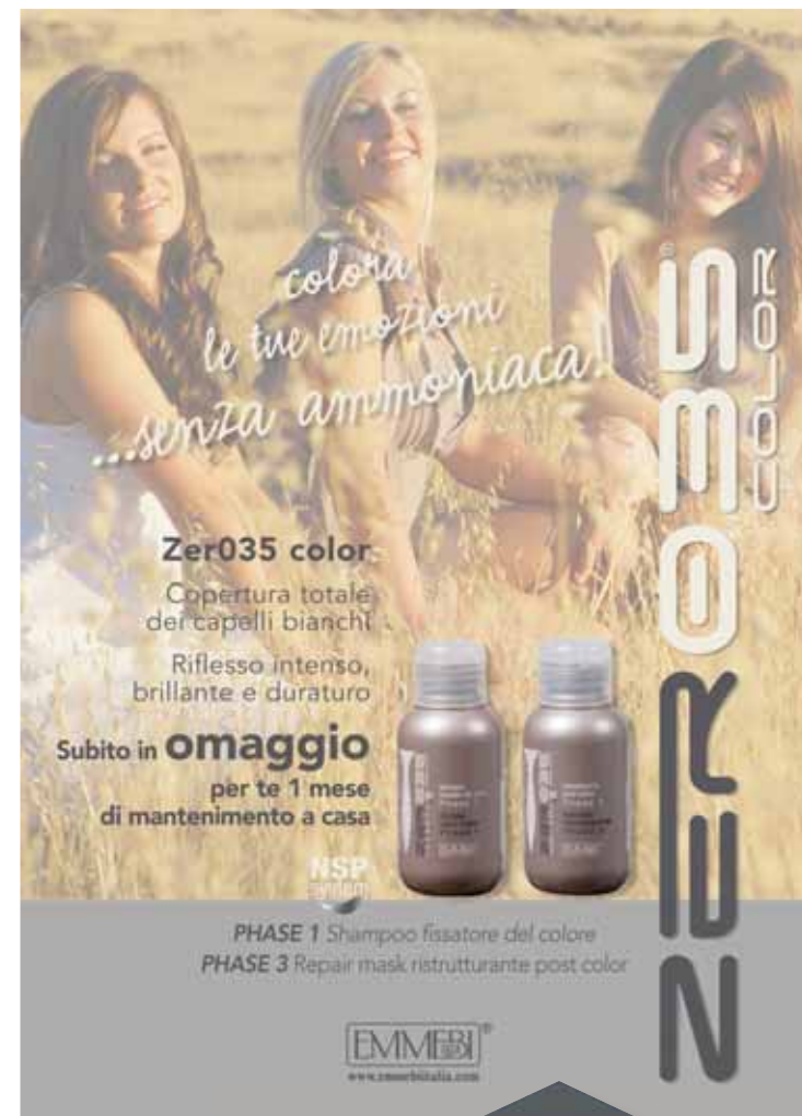
Zer035 color asztali bemutató