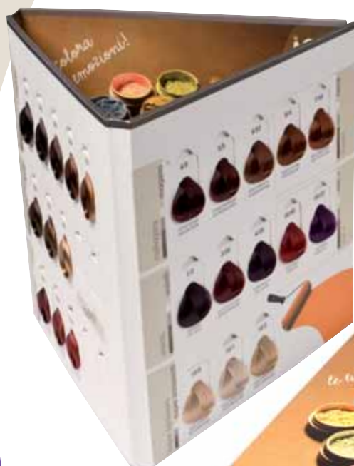
Zer035 color színskála nagy