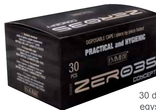
Zer035 color 30 db-os csomagolású egyszer használatos beterítő