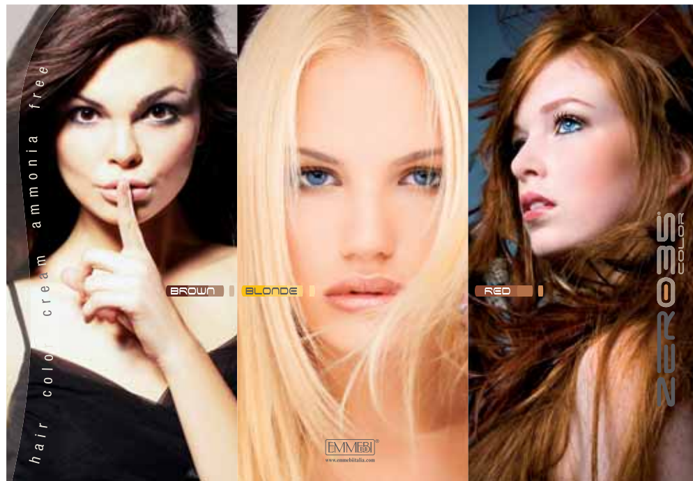
Zer035 color poszter 100 x 70 cm