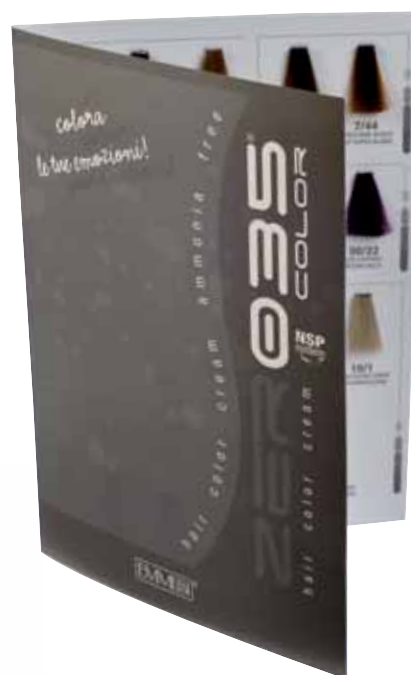
Zer035 color színskála kicsi