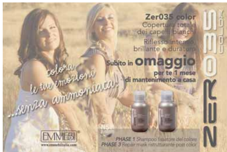
Zer035 color elektrosztatikus promókártya