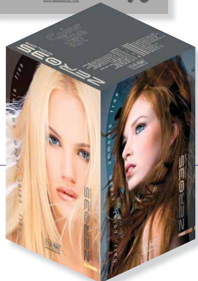
Zer035 color Color line készlet